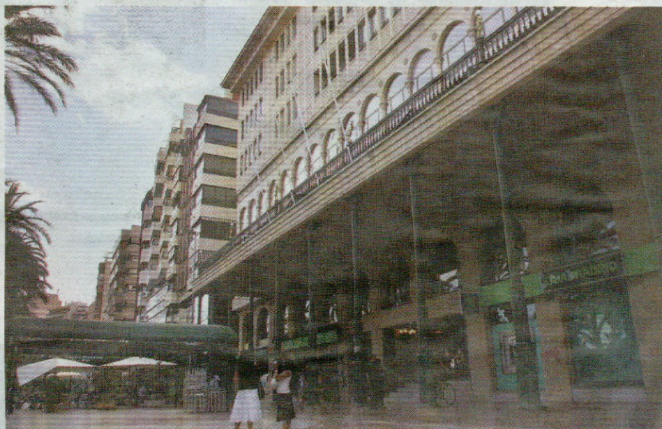
El Casino, con sede en La Explanada, ha cambiado su nombre para llamarse Real Liceo y Casino de Alicante.

Tras concederle el título, el Casino cambió su denominación para llamarse Real Liceo y Casino de Alicante y potenciar su papel dentro de la historia cultural de Alicante.